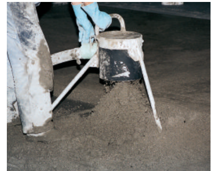
PCI Novoment Z3 für beschleunigt härtende Estriche hat eine lange Verarbeitbarkeitsdauer von ca. 1 Stunde und ist – auch bei höheren Temperaturen – für Pumpenförderung geeignet.