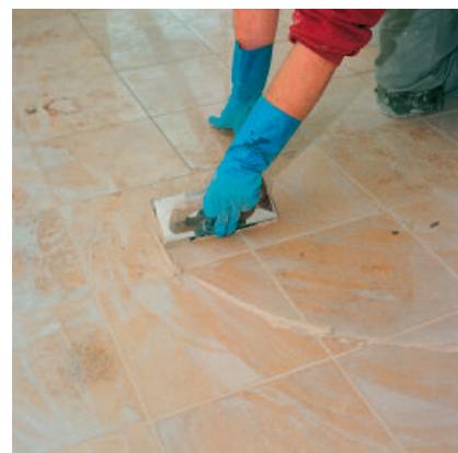
Mit PCI Carrafug können auch empfindliche Naturwerksteinbeläge sicher und verfärbungsfrei verfugt werden.