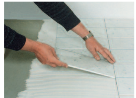
PCI Carraflex für die anwendungssichere Verlegung von Natursteinplatten und Marmor.