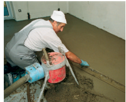
Mit Estrich-Schnellzement PCI Novoment Z1 hergestellte Estriche sind bereits nach ca. 3 Stunden begehbar und schon nach ca. 1 Tag mit keramischen Belägen belegbar.