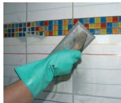
Komfortables, temperaturunabhängiges Verarbeitungsprofil – PCI Nanofug lässt sich geschmeidig leicht in die Fuge einarbeiten.