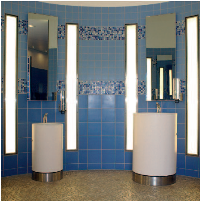
Variables Leistungsspektrum – für alle Fugenbreiten und alle keramischen Beläge.

4 Nach dem Abtrocknen den verbleibenden Mörtelschleier mit einem leicht feuchten Schwamm entfernen.